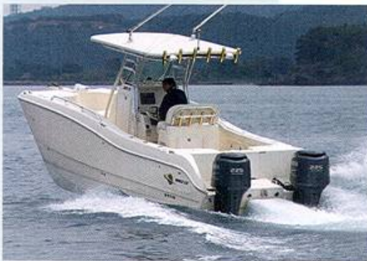
Il World Cat 270 TE, spinto da 450 cv, raggiunge la velocità di 45 nodi.

Hard top Verricello elettrico Divergenti Piattaforma di poppa Timoneria elettrica Prendisole di prua